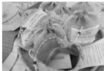
Malēniešu gaismas maisi