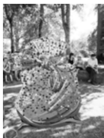
Malēnieši svētkos pierādīja, ka prot izgriezt pogas ikvienam