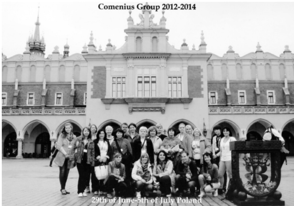
Projekta partneri, tiekoties Polijā

Katra valsts prezentēja projekta noslēguma rezultātus. Latvijas pārzīnā bija apkopot plakātus, ko