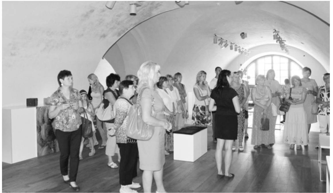
Konkursa dalībnieki pieredzes apmaiņas braucienā Daugavpilī