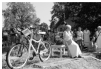
Alūksnes un Apes novadu fondu Labdarības akcijas noslēgums