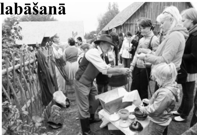
Pļaujas svētkos šogad īpaša uzmanība būs veltīta maizes cepšanas tradīcijām