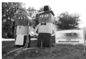
Svētku apmeklētājus sagaida ontīgi malēnieši