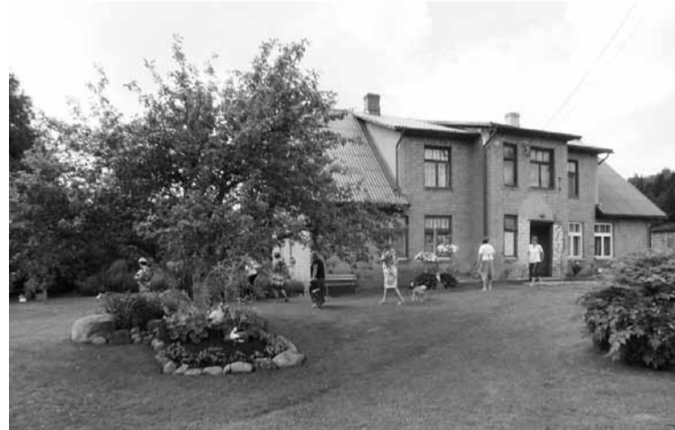
Viena no konkursam pieteiktajām daudzdzīvokļu mājām - Ziemera pagasta “Vainagi” apliecina, kā kaimiņi, katrs pēc saviem spēkiem, var rūpēties par sava nama apkārtnes sakopšanu