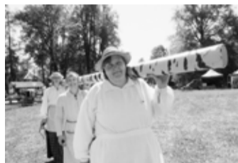
Neiztrūka balža nešana