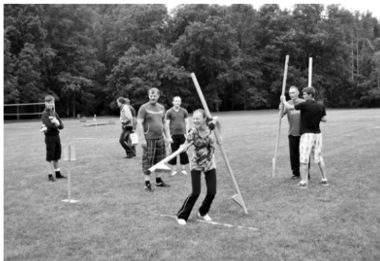
Jaunannas netradicionālās sporta spēles dalībniekiem nācās tikt galā ar dažādām sportiskām disciplīnām

Katrās spēlēs tiesnešu komanda veicamos uzdevumus un disciplīnas izveido atšķirīgus un iepriekšējiem gadiem, lai gan ir dažādi elementi, kas iepatikušies dalībniekiem un tiesnešiem, tāpēc tiek iekļauti komandu lielajā stafetē. Disciplīnu nosaukumi ir netradicionāli un atjautīgi, kas ne vienmēr ļauj noprast, kāds uzdevums sagaidāms. Šogad komandām bija jāpārvar šādas disciplīnas: „Purva bridējs”, „Neveiklā čāpošana”, „Ogu grozi”, „Pārcēlājs”, „Aklais banķieris”, „Zaķusalas zaķīši”, „Dīķīša sargāšana”, „Marsiešu boulingš”, „Stiprā elpa”, „Bumbiņdzīšana”, „Nepaklausīgā vinča”, „Ķekatnieku futbols”. Spēles sākās ar galvenā tiesneša