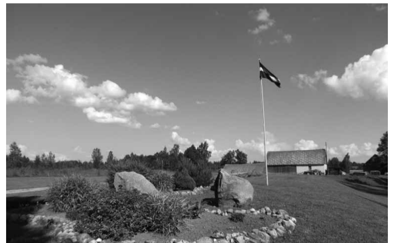
Vēl neiebraucot Alsviķu pagasta “Jaunniedrās”, kur saimnieko Drelnieku ģimene, ciemiņu sagaida krāšņa dobe un goda vietā - valsts karogs, bet skats, kas pavēras, tuvojoties sētai un no pakalna veroties uz to, patiesi aizrauj elpu