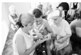
Malēniešu vārdu spēle muzejā